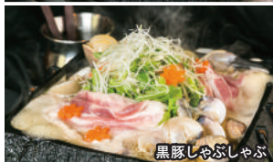
黒豚しゃぶしゃぶ