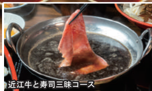
近江牛と寿司三昧コース