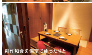
創作和食を個室でゆったりと