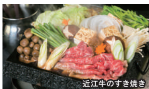
近江牛のすき焼き