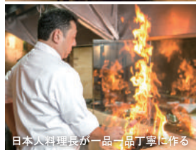
日本人料理長が一品一品丁寧に作る