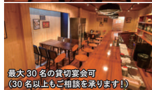
最大30名の貸切宴会可 （30名以上もご相談を承ります!）

お得! 「パンめし見た」で、 コースの飲放題を 30分延長で2.5時間に! (2020年5月末日まで)