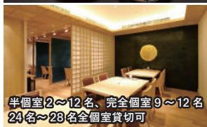
半個室2〜12名、完全個室9〜12名 24名〜28名全個室貸切可