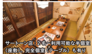
サートーン店：2名～利用可能な半個室(座敷)。完全個室(テーブル)も有り