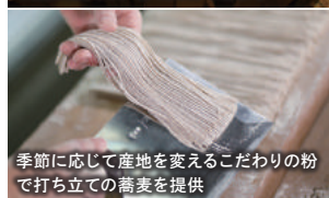
季節に応じて産地を変えるこだわりの粉で打ち立ての蕎麦を提供