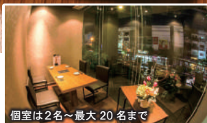
個室は2名～最大 20 名まで