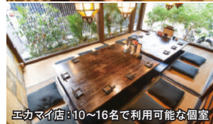
エカマイ店：10～16名で利用可能な個室