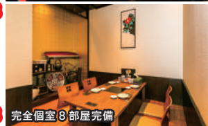
完全個室(8部屋完備)

お得！ 「バンめし見た」で 前日までに6名以上で ご予約の方は 飲放題2時間→3時間に！ ※コースメニューは割引券及びVIPカードの ご利用はできません。 (2020年2月末日まで)