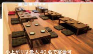
小上がりは最大 40 名で宴会可