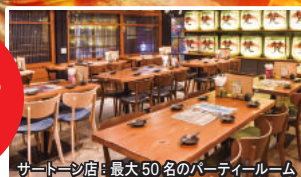
サートーン店：最大50名のパーティールーム

ビール、日本酒、焼酎、ハイボール、サワー、カクテル、ワイン、梅酒 ※L.O.30分前