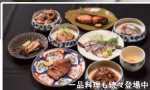
一品料理も続々登場中

※全てメインに鍋を含みます ※土日はお昼から対応可 ※コース有効期限：2020年4月末