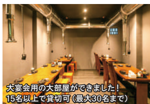
大宴会用の大部屋ができました! 15名以上で貸切可(最大30名まで)

8名以上のご予約で 飲み放題付き コミコミコース 1,000B~ コース内容は ご予算に合わせて ご相談下さい (焼肉を焼いてのご提供や居酒屋 メニューのみ、ホルモン多めなど 相談OK)