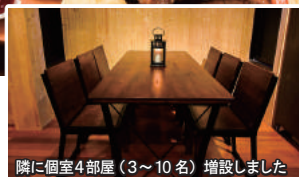
隣に個室4部屋（3～10名）増設しました