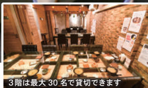
3階は最大 30 名で貸切できます