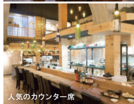
人気のカウンター席