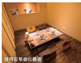
接待忘年会に最適