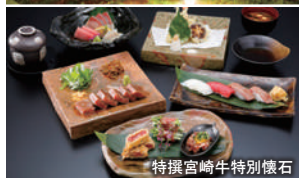
特撰宮崎牛特別懷石