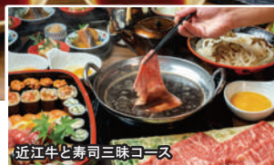
近江牛と寿司三昧コース