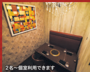
2名～個室利用できます