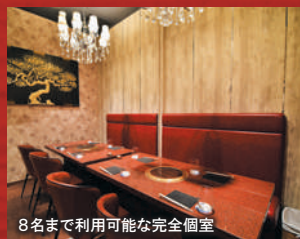
8名まで利用可能な完全個室