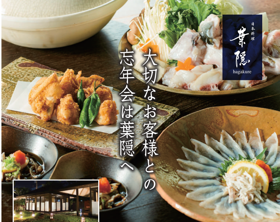
完全個室の離れでごゆっくりと