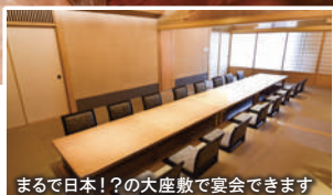
まるで日本！？の大座敷で宴会できます