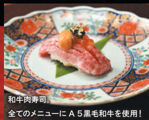
和牛肉寿司。 全てのメニューに A5 黒毛和牛を使用！