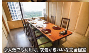
少人数でも利用可。夜景がきれいな完全個室