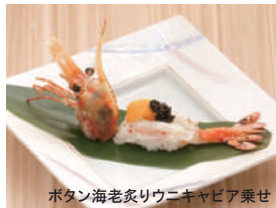
ボタン海老炙りウニキャビア乗せ