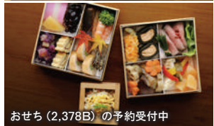
おせち (2,378B) の予約受付中

◎忘年会限定サービスコース 1,200B 全7品 2名様～ 前日までに要予約 料理 飲放題 +500B