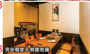
完全個室8部屋完備

お得！ 「バンめし見た」で 前日までに6名以上で ご予約の方は 飲放題2時間→3時間に！ ※コースメニューは割引券及びVIPカードの ご利用はできません。 (2020年1月末日まで)