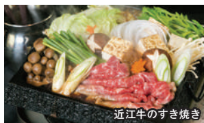
近江牛のすき焼き