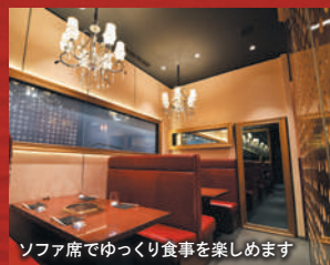
ソファ席でゆっくり食事を楽めます