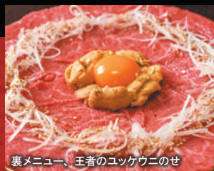
裏メニュー、王者のユッケウニのせ