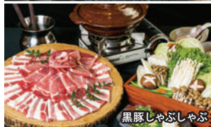
黒豚しゃぶしゃぶ