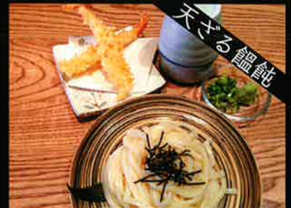
《828》天ざるうどん tempura udon 249 B