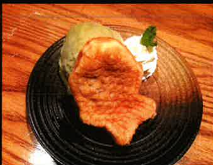
《848》鯛焼き抹茶アイス Taiyaki With Maccha Icecream 99 B