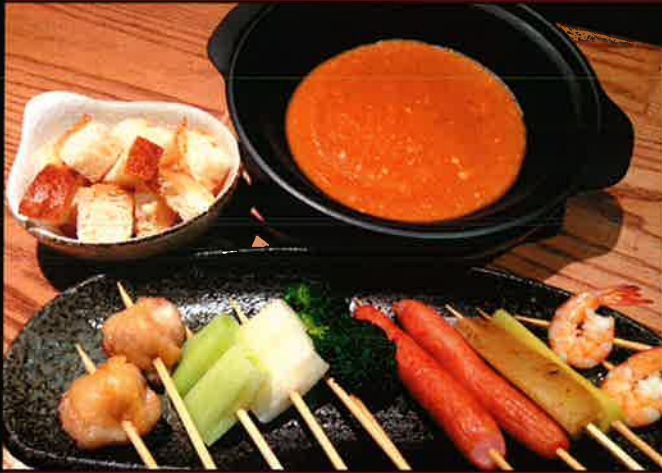
691 味噌チーズフォンデュ