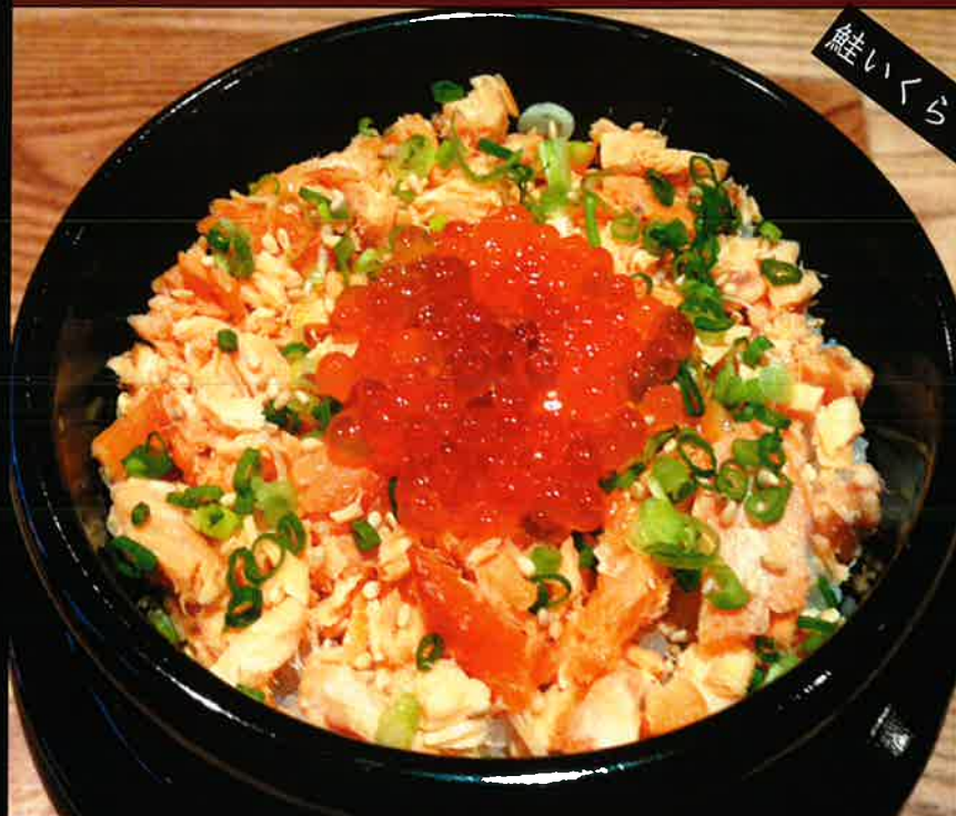
《781》 鮭・いくら釜めし salmon & salmon roe kamameshi 329 B