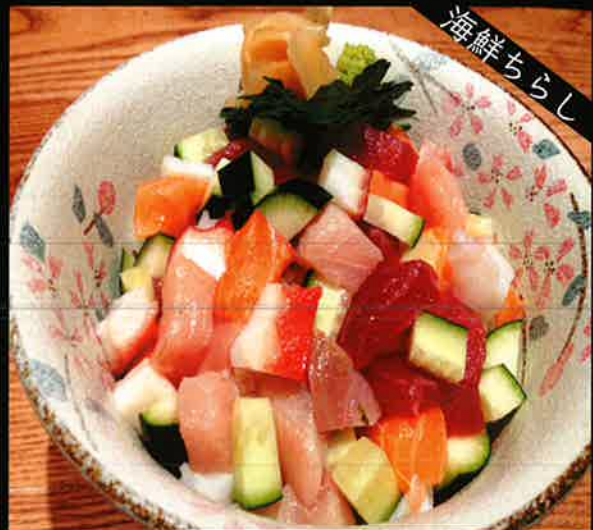
《772》海鮮ちらし丼 seafood bowl 389 B