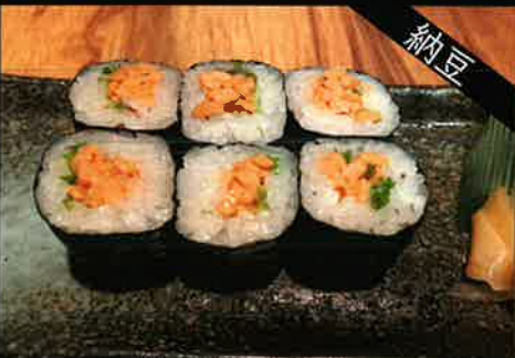
《746》納豆巻き fermented soybeans roll 129 B