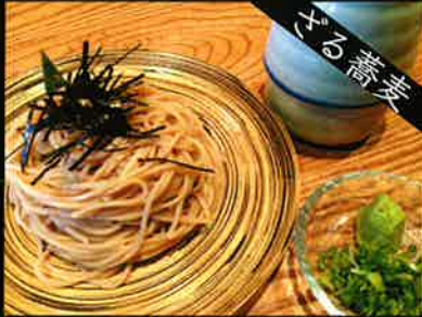
《821》ざるそば soba 139 B