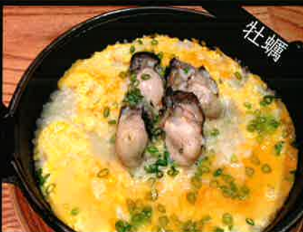
《802》牡蠣雑炊 oyster rice porridge 299 B