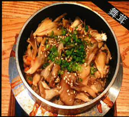
《790》舞茸釜めし maitake mushroom kamameshi 249 B