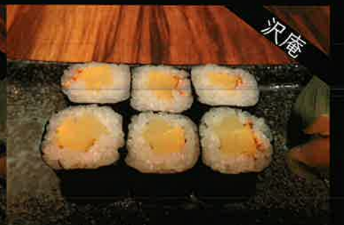
《748》たくあん巻き yellow pickled radish roll 119 B