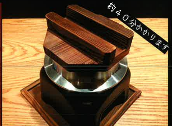
《723》焚きたて 釜焚きごはん kettle cooked rice 189 B