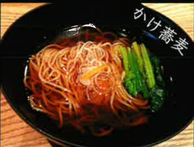
《831》かけそば soba 139 B