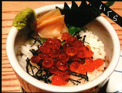
《762》ミニ いくら丼 salmon roe mini bowl 199 B