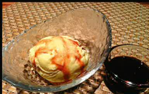
《861》カシス&バニラアイス Cassis & Vanilla Icecream 149 B