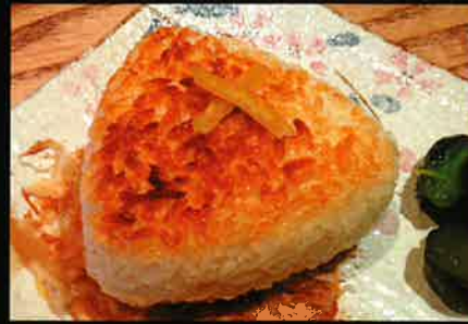
《718》焼きおにぎり(梅・鮭・明太子) grilled rice ball (plum · salmon · mentaiko) 99 B