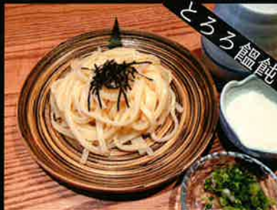
《827》とろろうどん udon with grated yam 189 B