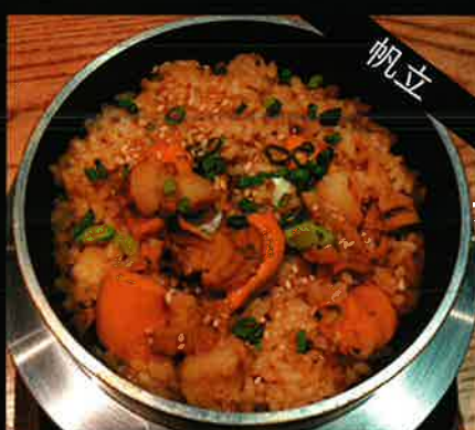
《785》 帆立釜めし scallop kamameshi 289 B