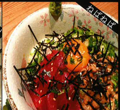
《716》ばんや丼 banya bowl 289 B (nattou, chinese yam, okura, tuna etc)