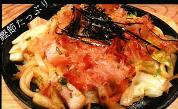
《811》和だし香る 焼きうどん fried udon 219B