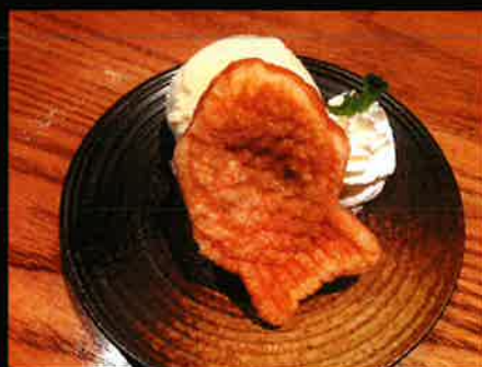
《847》鯛焼きバニラアイス Taiyaki With Vanilla Icecream 99 B