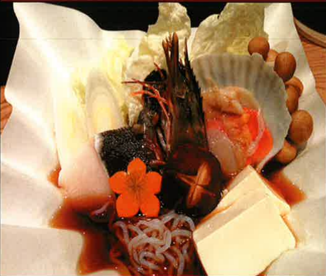
693 海鮮 だし醤油鍋

dashi soy sauce hot pot stew made with seafood