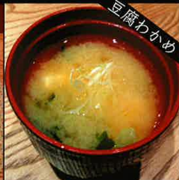
《726》豆腐・わかめの味噌汁 tofu seaweed miso soup 59 B