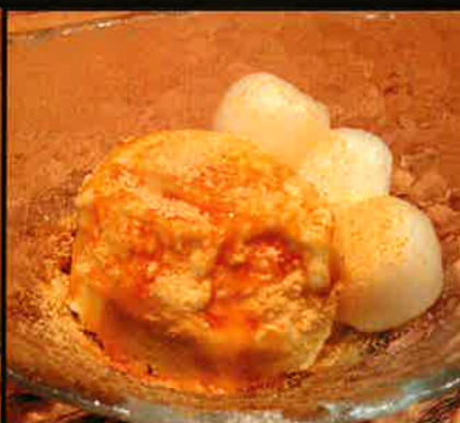
《845》白玉バニラアイス Shiratama Vanilla Icecream 99 B