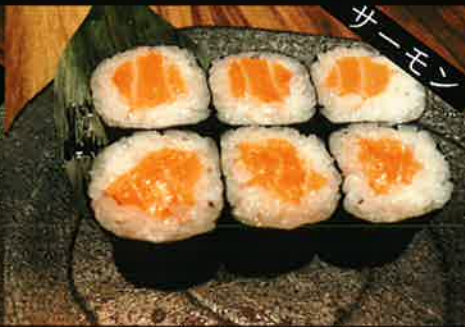
《742》サーモン巻き salmon roll 139 B