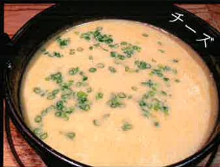
《801》チーズ雑炊 cheese rice porridge 249 B