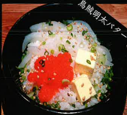
《784》 いか明太子釜めし squid & mentaiko kamameshi 269 B