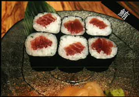
《741》鉄火巻き tuna roll 149 B