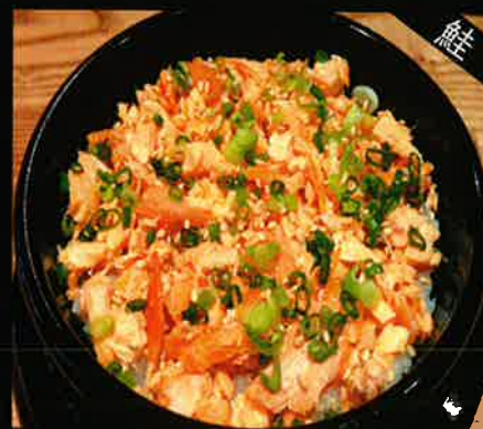
《782》 鮭釜めし salmon kamameshi 269 B