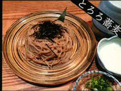
《822》とろろそば soba with grated yam 189 B