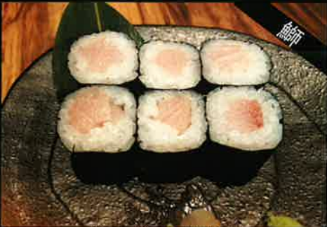
《744》ぶり巻き yellowtail roll 159 B