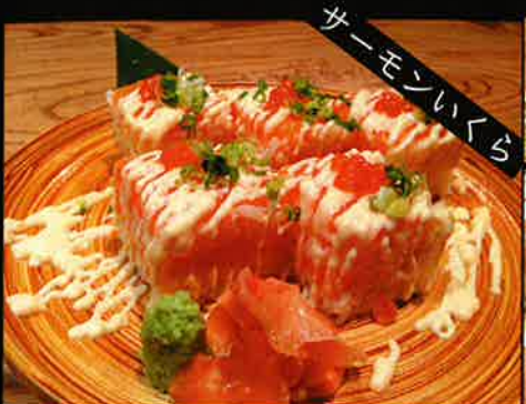
《751》サーモンといくらの押し寿司 salmon & salmon roe oshisushi 399 B