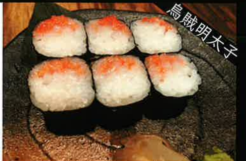
《745》いか・明太子巻き squid & mentaiko roll 139 B