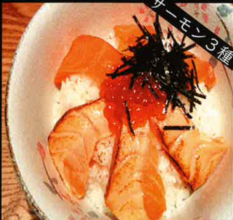
《773》サーモン3種丼 3 varieties of salmon bowl 339 B (raw, grilled, salmon roe)