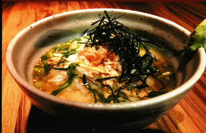
《714》だし茶漬け (梅、鮭、明太子) 149B boiled rice with dashi(plum · salmon · mentaiko)