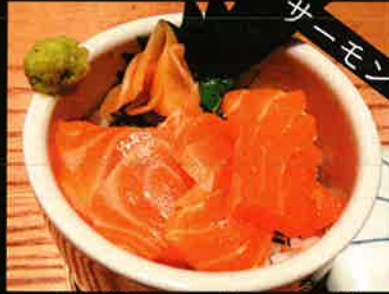
《764》ミニ サーモン丼 salmon mini bowl 139 B