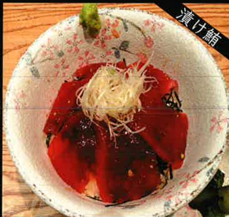
《771》漬けまぐろ丼 marinated tuna bowl 299 B