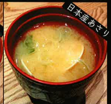
《727》あさりの味噌汁 clam miso soup 99 B

The price does not include additional 7% VAT and 10% Service Charge