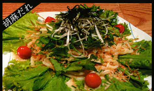
《814》たっぷり野菜のサラダうどん salad udon 239B