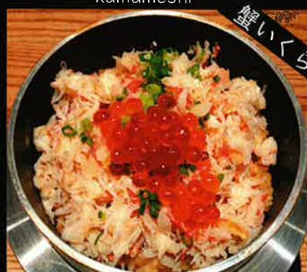
《789》 かに・いくら釜めし crab & salmon roe kamameshi 429 B