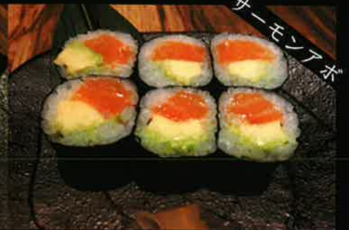
《743》サーモン・アボカド巻き salmon & avocado roll 159 B