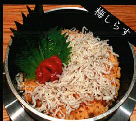
《786》 梅と大葉のしらす釜めし ocellated octopus kamameshi 249 B