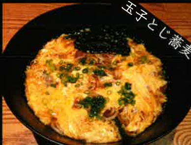
《832》玉子とじそば beaten egg soba 179 B