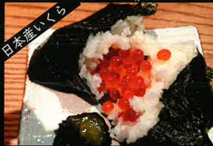
《720》いくらおにぎり salmon roe rice ball 139 B