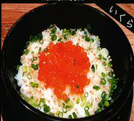
《787》 いくら釜めし salmon roe kamameshi 369 B