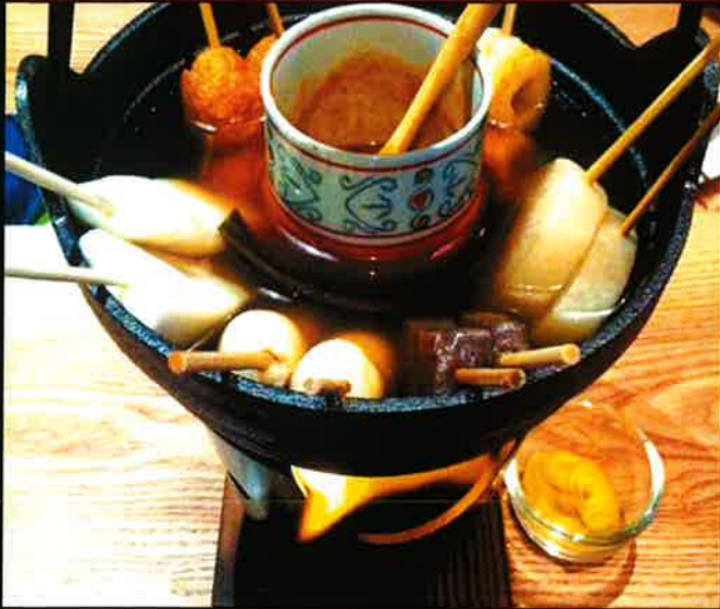
《695》 ばんや特製おでん鍋 oden