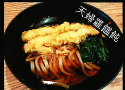
《838》天婦羅うどん tempura udon 249 B