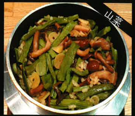
《792》山菜釜めし edible wild plants 249 B