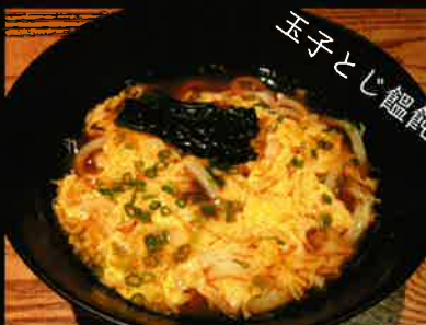
《837》玉子とじうどん beaten egg udon 179 B