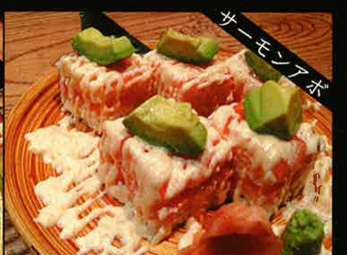
《753》サーモンとアボカドの押し寿司 salmon & avocado oshisushi 389 B