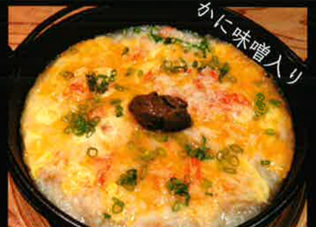
《803》かに雑炊 crab rice porridge 369 B