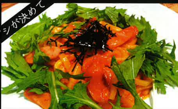
《813》和風 うどんナポリタン udon neapolitan 219B