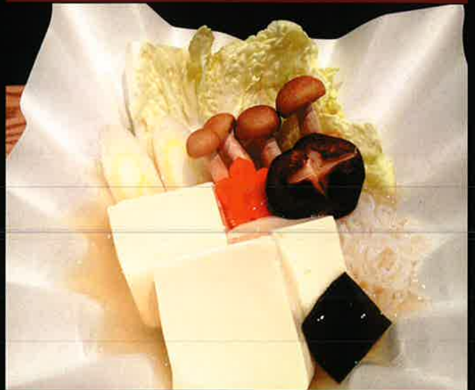
《698》 湯豆腐 boiled tofu