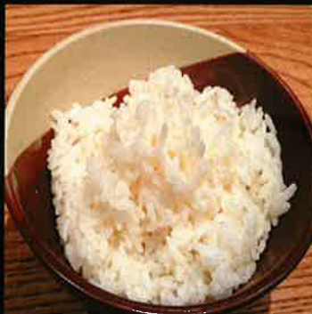
《724》ごはん rice 59 B