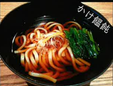
《836》かけうどん udon 139 B