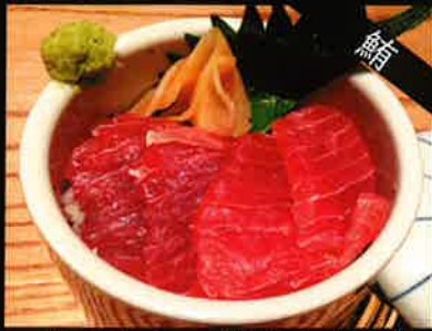
《761》ミニ 漬けまぐろ丼 marinated tuna mini bowl 149 B