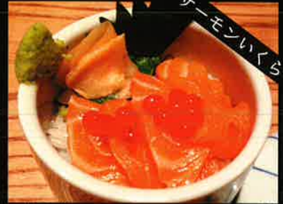
《765》ミニ サーモン・いくら丼 salmon & salmon roe mini bowl 169 B