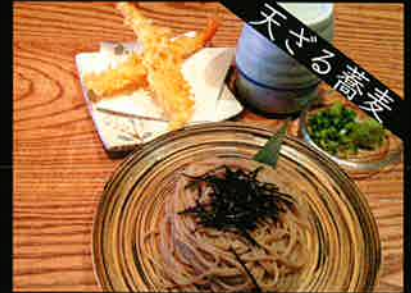
《823》天ざるそば tempura soba 249 B