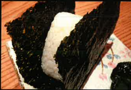
《719》おにぎり(梅・鮭・明太子) rice ball 79 B (plum · salmon · mentaiko)