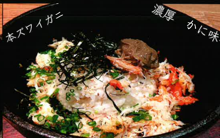
《713》石焼 本ズワイガニ ビビンバ crab stone roasted bibimbap 389B