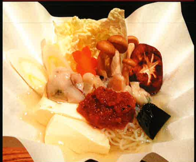
694 牡蠣の特製味噌鍋