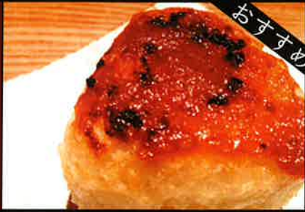
《717》みそ焼きおにぎり miso grilled rice ball 99 B