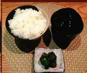
《725》ごはんセット (ごはん・味噌汁・お新香) 109 B rice set rice, miso soup, tsukemono