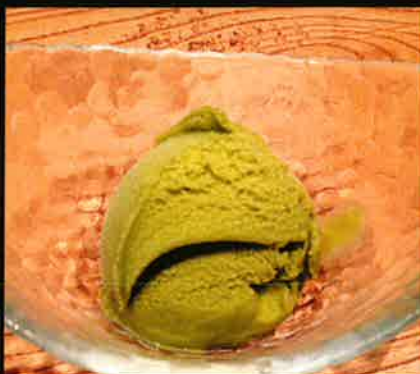
《842》抹茶アイス Maccha Icecream 69 B