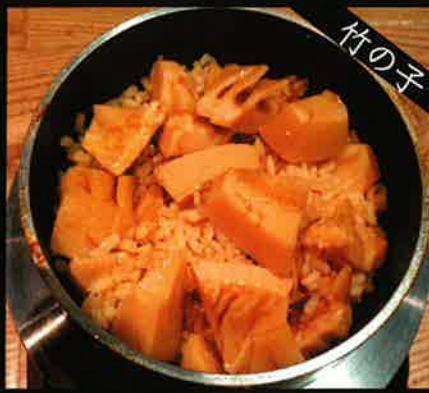
《791》竹の子釜めし bamboo shoot kamameshi 249 B