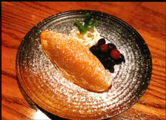
《849》なめらかスイーツポテト Sweet Potato Tart 129 B