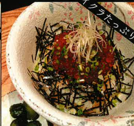
《774》たっぷり入ったいくら丼 salmon roe bowl 489 B