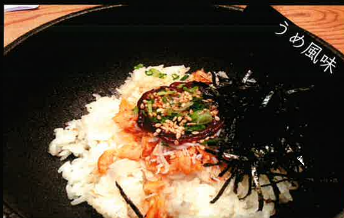
《712》石焼 鮭とジャコ ビビンバ salmon icefish stone roasted bibimbap 269B