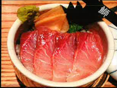
《763》ミニ ぶり丼 yellowtail mini bowl 159 B