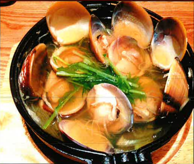
《697》 あさりのはりはり鍋 hot pot stew made with clam