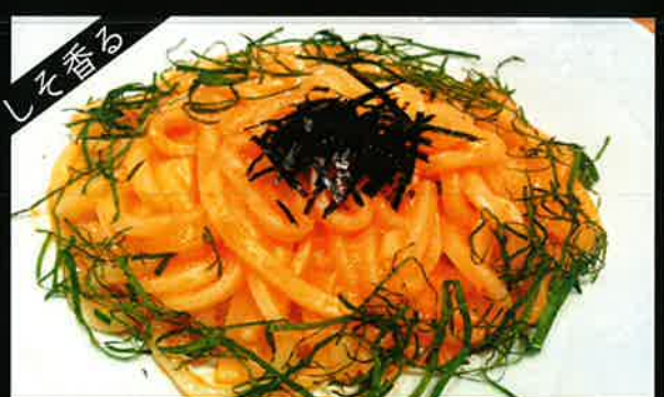
《812》しそ香る 明太子うどん mentaiko udon 249B