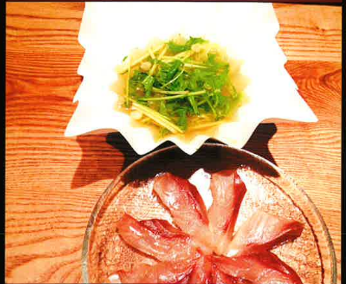
《696》 ぶりのねぎしゃぶしゃぶ yellowtail shabushabu