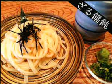
《826》ざるうどん udon 139 B