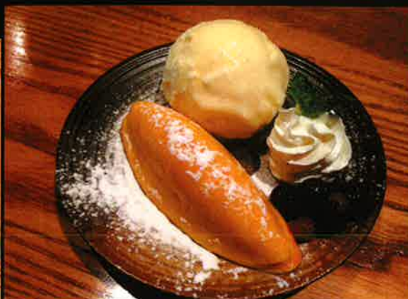
《843》なめらかスイーツポテト&バニラアイス Sweet Potato & Vanilla Icecream 169 B