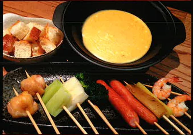
692 柚子胡椒チーズフォンデュ

海老、ソーセージ、竹輪 shrimp, sausage, tube-shaped fish paste cake こんにゃく、おくら、長ねぎ、フランスパン devil's tongue, okura, green onion, french bread