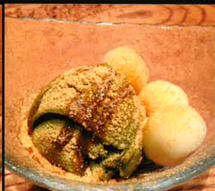
《846》白玉抹茶アイス Shiratama Maccha Icecream 99 B