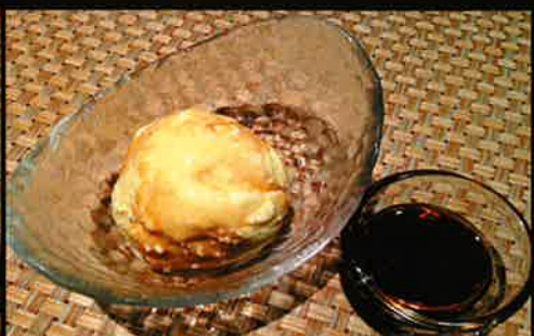
《862》カルーア&バニラアイス Kahlua & Vanilla Icecream 149 B