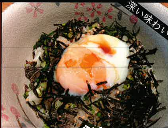
《722》半熟卵かけごはん put soft boiled egg on rice 149 B