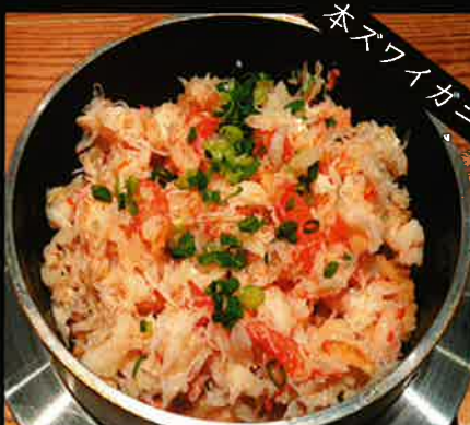
《788》 かに釜めし crab kamameshi 369 B