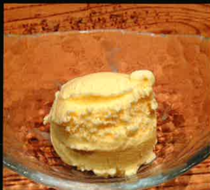
《841》バニラアイス Vanilla Icecream 69 B