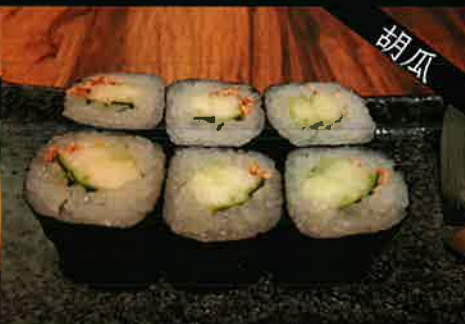
《747》かっぱ巻き cucumber roll 109 B