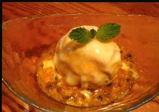
《844》パッションフルーツ バニラアイス PassionFruit With Vanilla Icecream 99 B