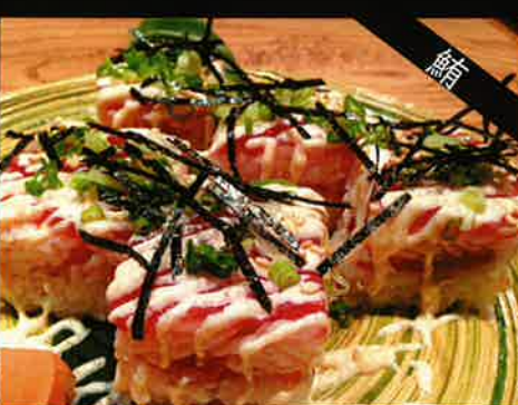
《752》漬けまぐろの押し寿司 marinated tuna oshisushi 369 B