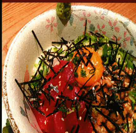
716 ばんや丼 banya bowl 289B (nattou, chinese yam, okura, tuna etc)

ネバネバ好きには堪らない逸品 納豆・長芋・オクラ・鯖などなど がっつり混ぜて召し上がれ!