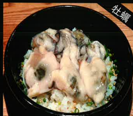
《783》 牡蠣釜めし oyster kamameshi 349 B