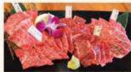
Photo is 500g