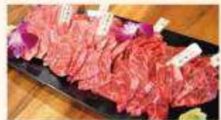
Photo is 700g