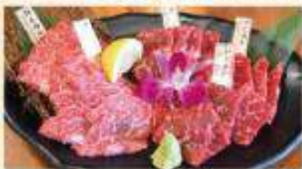
Photo is 300g

403 “本日の極み SP” 4・5人前 700g 大満足 2,520B ชุดโมริอวาระ เนื้อคุณภาพดีที่สุด "สุดยอดของเนื้อวัว เมนูพิเศษ" สำหรับ 4-5 ท่าน 700g "Today's Most Premium Beef Special" (MORIAWASE Set) the best quality of beef 700g (For 4-5 people)